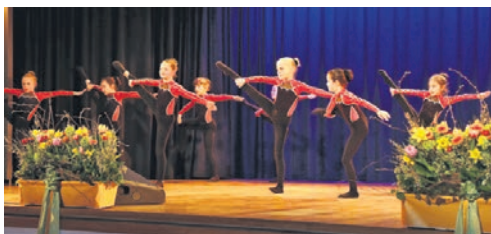
Sportliches Entertainment vom Feinsten lieferten die Team-Gym-Sportlerinnen

Es folgte ein abwechslungsreicher Abend, an dem insgesamt 166 Sportler und Trainer aus den Sportarten Ballett, Beach Volleyball, Einrad, Gerätturnen, Teamgym, Golf, Judo, Karate, Leichtathletik, Rehasport Schwimmen, Rhönrad, Rudern, Schwimmen, Sportkegeln, Tanzsport, Tennis und Volleyball geehrt wurden. Höhepunkt