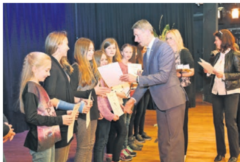
Strahlende Gesichter bei der Überreichung der Urkunden

des Abends waren dann die Damen des SV Lohhof Volleyball, die mit der deutschen Ü-50-Auswahl den Weltmeistertitel gewinnen konnten. Großartig unterhalten wurden die Anwesenden dabei von Tanz- und Trampolinaufführungen der Teamgym-Sportlerinnen. Nachdem die Sportler ihre Medaillen und Urkunden erhalten hatten, eröffnete Erster Bürgermeister Böck im Foyer das Buffet, das mit Fingerfood, Burgern und vielen weiteren sportlichen Köstlichkeiten bestückt war.