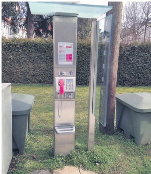
Nicht mehr kostendeckend. Wie diese Anlage in der Lilienstraße sollen 7 von 18 öffentlichen Telefonen abgebaut werden.

Die Stadt selbst hat keine Möglichkeiten, den Abbau zu verhindern. Die Stadtverwaltung hat bereits 2013 in einer Stellungnahme gegenüber der Telekom dargelegt, dass sie einem ersatzlosen Abbau der Telefonzellen nicht zustimmen kann, da die Anlagen für einen Teil der Bevölkerung und auch im akuten Notfall von wichtiger Bedeutung sein können. Deshalb wird die Stadtverwaltung auf Beschluss des Grundstücks- und Bauausschusses auch dieses Mal auf die Telekom dahingehend einwirken, vom geplanten Abbau abzusehen.