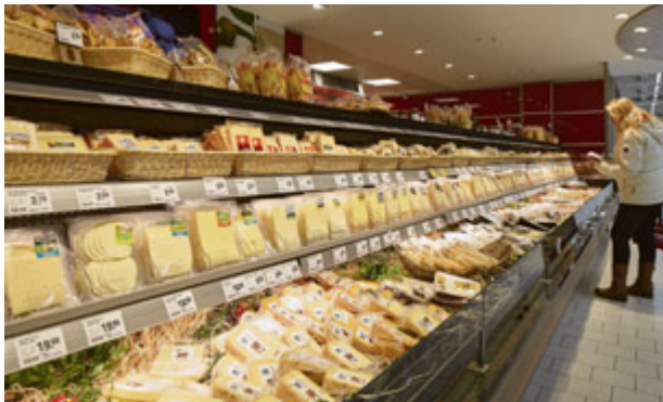
Eine enorme Käseauswahl bietet der neue REWE sowohl an der SB- als auch an der Bedientheke.