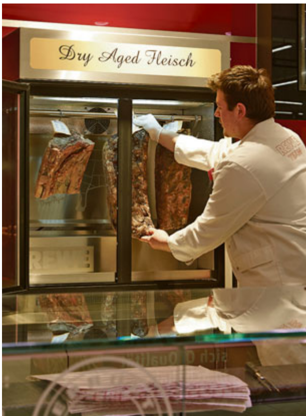
Dry Aged Fleisch, Qualität die auf der Zunge zergeht.