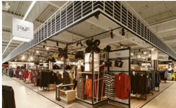
Das Modelabel F & F, überrascht mit Qualität, modischem Design und fairen Preisen.