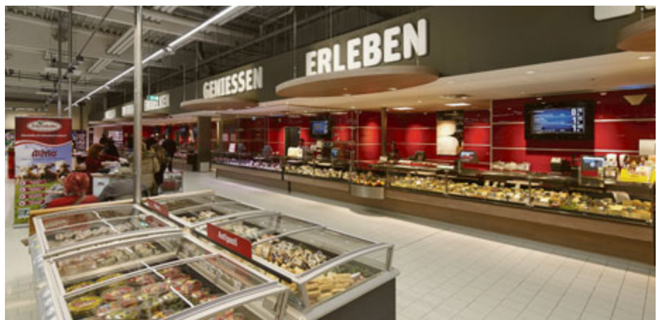
An der langen Frischetheke macht Einkaufen richtig Laune.

85221 Dachau Kopernikusstraße 2 Mo – Sa, 7 – 20 Uhr geöffnet