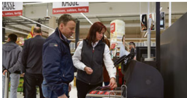
Neue SB Kassen machen den Einkauf noch flotter.