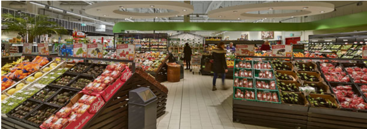
Übersichtlich, gut sortiert und knackig frisch wartet Gemüse und Obst auf die Kunden.

Das beliebte REWE-Center in Dachau-Ost macht jetzt den Einkauf zum Erlebnis