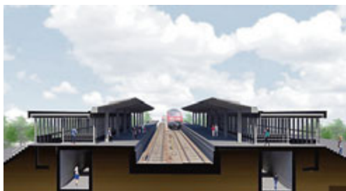
Querschnitt des geplanten barrierefreien Bahnhofes Unterschleißheim aus südl. Perspektive

Interessierte haben auch auf der UGA vom 15. – 17.04.2016 die Möglichkeit, sich am Stand der Stadt über den barrierefreien Ausbau des S-Bahnhofes Unterschleißheim zu informieren.