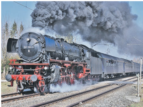
Die Dampflok 01180 wurde im vergangenen Jahr nach 40 Jahren Stillstand in der Schweiz durch das Bayerische Eisenbahnmuseum wieder in Betrieb genommen.

Info: BayernBahn Buchungsservice, Telefon 0 90 81 / 27282-61, buchung@bayernbahn.de