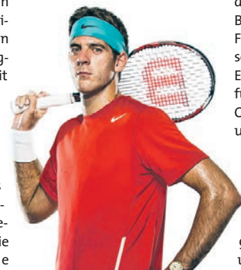
Juan Martin del Potro. VA

Eintrittskarten für die BMW Open by FWU AG und weitere Informationen zu dem Münchner ATP World Tour-Turnier gibt's online unter www.bmwopen.de