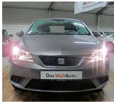
Seat Ibiza 1,2 TSI Reference - Klima , Technic Grau, Benzin, 66 kW, 50 km, EZ 26.11.15, Mobiles Navigationssystem, Leuchtweitenregulierung, Tagfahrlicht, USB-Anschluss, Bordcomputer u.v.m. (Umsatzsteuer ausweisbar) € 12.990,-