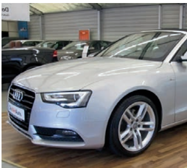
Audi A5 Cabriolet 1,8 TFSI Multitronic , Eissilber Metallic, Benzin, 125 kW, 71.600 km, EZ 26.7.12, Komfortklimaautomatik 3 Zonen, Heckleuchten LED, Lederausstattung, Xenon, S line Sport, Tempomat u.v.m. (Umsatzsteuer ausweisbar) € 28.990,-