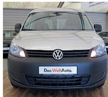
VW Caddy Kasten 1,6 TDI DPF - AHK , Reflexsilber Metallic, Diesel, 75 kW, 41.300 km, EZ 29.1.13, „Flexsitz Plus Paket“, Zentralverriegelung m. Funkfernbedienung, Tagfahrlicht, u.v.m. (Umsatzsteuer ausweisbar) € 11.990,-