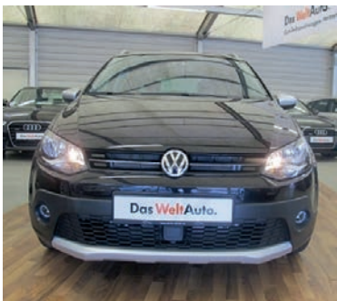
VW Polo Cross 1,2 TSI BMT - ACC , Deep Black Perleffekt, Benzin, 66 kW, 50 km, EZ 30.11.15, Climatronic, Berganfahrassistent, Mobiles Navigationssystem, Müdigkeitserkennung, u.v.m. (Umsatzsteuer ausweisbar) € 16.990,-