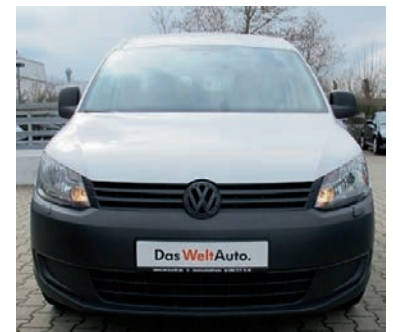
VW Caddy Maxi Life 2,0 TDI DPF Kombi , Candy-Weiß, Diesel, 103 kW, 95.300 km, EZ 20.3.13, Klimaanlage Climatic, Sitzheizung, Winter-Paket, Einparkhilfe hinten, Audiosystem u.v.m. (Umsatzsteuer ausweisbar) € 17.990,-