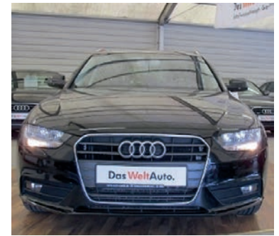
Audi A4 Avant 2,0 TDI DPF Attraction, Brillantschwarz, Diesel, 88 kW, 110.500 km, EZ 26.4.13, Klimaautomatik, Leuchtweitenregulierung, Audiosystem „chorus“, Panoramadach u.v.m. (Umsatzsteuer ausweisbar) € 17.990,-