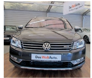
VW Passat Variant Alltrack 2,0 TDI DSG, Black Oak Brown Metallic, Diesel, 125 kW, 35.900 km, EZ 23.8.13, Klimaautomatik, Lederausstattung „Nappa“, Abbiegelicht, Sitzheizung u.v.m. (Umsatzsteuer ausweisbar) € 31.990,-