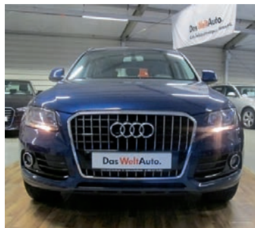
Audi Q5 2,0 TDI Quattro S tronic - AHK , Scubablau Metallic, Diesel, 130 kW, 105.700 km, EZ 17.12.12, Klimaautomatik, Kopf-Airbag-System, Einparkhilfe hinten, Multifunktionsanzeige u.v.m. (Umsatzsteuer ausweisbar) € 25.990,-