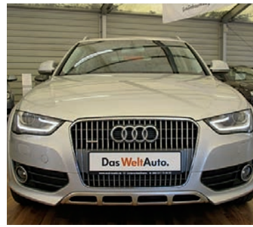
Audi A4 allroad 2,0 TFSI Quattro S , Eissilber Metallic, Benzin, 155 kW, 89.700 km, EZ 25.6.12, Komfortklimaautomatik 3 Zonen, Heckleuchten LED, Standheizung, Xenon-Plus, Multi-Media-Interface u.v.m. (Umsatzsteuer ausweisbar) € 28.990,-