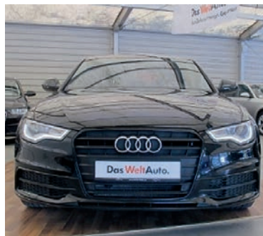
Audi A6 3,0 TDI Sport Selection , Brillantschwarz, Diesel, 150 kW, 113.700 km, EZ 3.4.13, Komfort-Klimaautomatik 2-Zonen, Sitzheizung für Vordersitze getrennt regelbar, Exterieur-Paket S line, u.v.m. (Umsatzsteuer ausweisbar) € 29.990,-