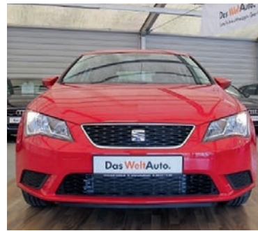
Seat Leon 1,2 TSI Reference (Euro 6) , Emocion Rot, Benzin, 81 kW, 50 km, EZ 19.4.16, Klima, Sitzheizung, Winterpaket, Lenkrad mit Multifunktion, Bordcomputer, Tagfahrlicht u.v.m. (Umsatzsteuer ausweisbar) € 16.990,-