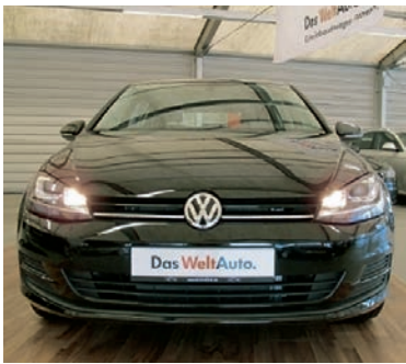
VW Golf VII 1,4 TSI BMT Comfortline , Schwarz, Benzin, 92 kW, 50 km, EZ 1.2.16, Climatic, Xenon, Licht- und Sicht-Paket, Tempomat, Lendenwirbelstützen, Lenkrad (Leder) mit Multifunktion u.v.m. (Umsatzsteuer ausweisbar) € 19.900,-