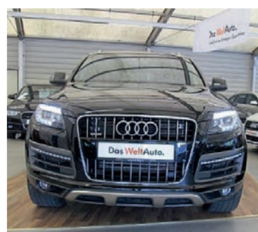
Audi Q7 3,0 TDI Quattro Tiptronic-S , Tiefschwarz, Diesel, 180 kW, 59.400 km, EZ 27.3.13, Klimaautomatik 4-Zonen, Lederausstattung, Sitzheizung, Xenon-Scheinwerfer Plus, MMI Navigation u.v.m. (Umsatzsteuer ausweisbar) € 41.990,-

Überdachter Ausstellungsplatz Montag bis Freitag 09.00 Uhr bis 18.00 Uhr Samstag 09.00 Uhr bis 13.00 Uhr Wir beraten Sie gerne: Georg Moraldis Tel: 089 / 317 758 - 11 Florian Langer Tel: 089 / 317 758 - 19