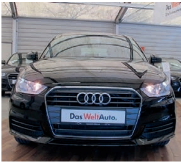
Audi A1 Sportback 1,0 TFSI ultra , Brillantschwarz, Benzin, 70 kW, 25 km, EZ 1.3.16, Klimaanlage, Sitzheizung vorn, Komfortpaket, Ablage-Paket, Innenlicht-Paket LED, Sideguard, Tempomat u.v.m. (Umsatzsteuer ausweisbar) € 16.990,-