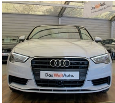
Audi A3 Cabriolet 2,0 TDI DPF , Gletscherweiss Metallic, Diesel, 110 kW, 26.900 km, EZ 24.3.14, Komfortklimaautomatik, Kurvenlicht, Leuchtweitenregulierung, LED-Scheinwerfer u.v.m. (Umsatzsteuer ausweisbar) € 31.990,-