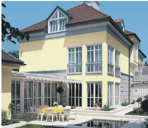
Auch große Dachüberstände schützen die Fassade vor Feuchtigkeit.

Da für die Minimierung von Algen- und Pilzbefall die schnelle Abtrocknung der Fassade entscheidend ist, ermöglicht die Oberflächenstruktur der neuesten Generation der NQG-Fassadenfarben (NQG 3 ), dass sich witterungsbedingte Feuchtigkeit gleichmäßiger auf der Wandfläche verteilt und rascher verdunsten kann. Das Ergebnis: Die Oberflächen trocknen schneller ab als mit herkömmlichen Produkten beschichtete Flächen und bieten so noch weniger Nährboden für Mikroorganismen.