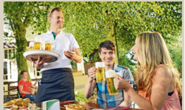
Lockeres Zusammensein mit Freunden an einem lauen Abend: Den Sommer kann man am besten in einem schönen Biergarten genießen.

unter den Bäumen getrunken – der Biergarten war geboren.