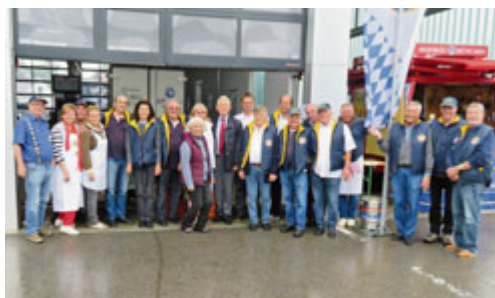
Die fleißigen Helferinnen und Helfer des Vereins