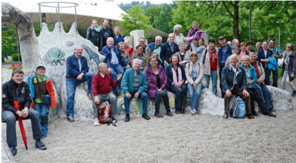
Die Lohhofer Kegler vor der Stadtführung in Kelheim

Los ging's am Samstag um 8 Uhr bei Regen, doch in Kelheim angekommen blinzelte die Sonne durch die Wolken. So konnten wir die interessante Stadtführung und die Schifffahrt durch