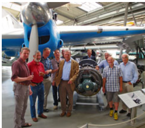
Die bei der Motorenübergabe anwesenden aktiven Mitglieder des Wertvereins an dem neuen Exponat im Museum Flugwerft Schleißheim