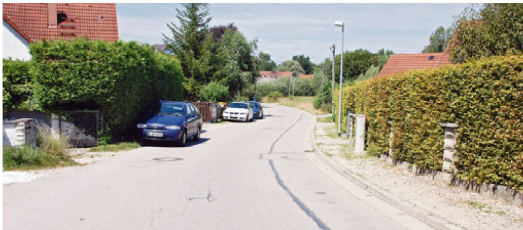
Der untere, besiedelte Teil der Hochstraße