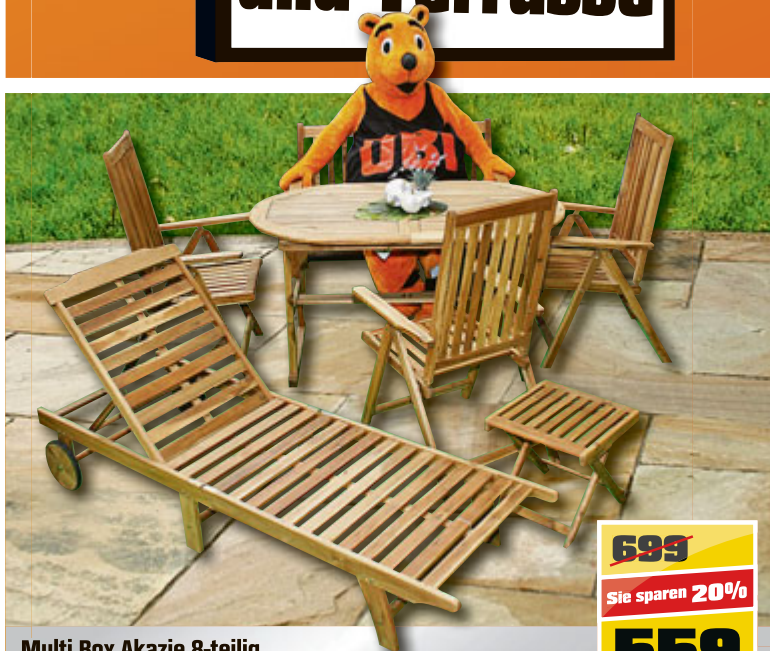
Multi Box Akazie 8-teilig bestehend aus 3 Stühlen, 2er Bank, Tisch, Beinauflage und Sonnenliege.