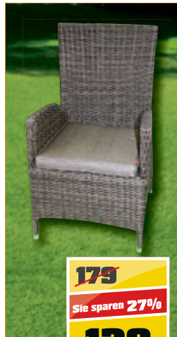
Stapelsessel aus pulverbeschichtetem Aluminiumgestell, Sitz- und Rückenfläche aus braunem Kunststoff-Rattengeflecht, stapelbar.