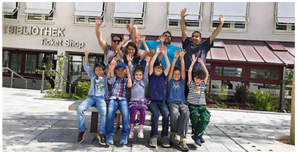
Auch letztes Jahr war der Spaß bei der Aktion Schöner Ferientag groß

dene Stationen mit Quizfragen dazu versteckt, die von Dir gelöst werden müssen.“ Treffpunkt: Sonntag, 11. September 2016 um 14.00 Uhr am Rathausplatz Noch sind einige Plätze frei, teilnehmen können kostenfrei alle Kinder zwischen 8 und 12 Jahren. Einfach anrufen unter 0151/23018275, auch kurzfristig. Stefan Krimmer, Stv. Ortsvorsitzender VdK Lohhof-Unterschleißheim