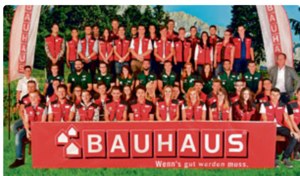
Die neuen Auszubildenden von BAUHAUS.

Bereits 1960 brachte BAUHAUS eine neue Idee nach Deutschland: Markenprodukte verschiedenster Fachsortimente in Selbstbedienung, angeboten unter einem Dach. Nach diesem erfolgreichen Konzept sind in Deutschland über 150 Fachcentren entstanden. Europaweit ist BAUHAUS in 19 Ländern über 260 Mal vertreten. Jedes der Fachcentren ist in 15 Fachgeschäfte untergliedert. Seinem Grundkonzept – Fachhandelsqualität und Produktvielfalt zu besten Preisen – ist BAUHAUS bis heute treu geblieben und hat dieses kontinuierlich weiterentwickelt.