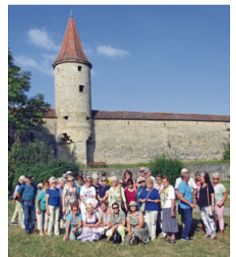
Die Haimhauser Besuchergruppe vor der Stadtmauer von Rothenburg