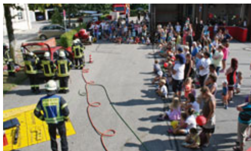
Vorführung technische Rettung der FFW Oberschleißheim beim Tag der offenen Tür