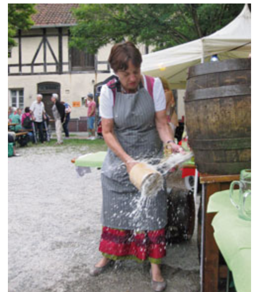
Ortsvereinsvorsitzende Ulrike Haerendel übt noch