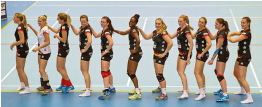
Die Mädels präsentieren den neuen Siegestanz nach dem 3:0