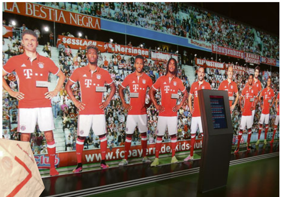
Da stehen sie, lebensgroß und stolz mit dem FC Bayern-Emblem auf der Brust: Thomas Müller, Kingsley Coman, Julian Green...

MÜNCHEN · Das Klicken der Foto- und Handy-Kameras hört man nur zu gut, wenn man sich in der FC Bayern Erlebniswelt dem Bereich der aktuellen Mannschaft nähert. Ohnehin sind die lebensgroßen Figuren der Spieler immer ein beliebtes Fotomotiv – ganz besonders jedoch zu Beginn einer neuen Saison. Dann strahlen die Spieler in neuem Glanz: im