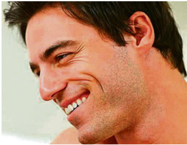
Männer mit voller Haarpracht gelten als jünger, erfolgreicher und attraktiver.

MÜNCHEN · Bereits um das 16. Lebensjahr kann bei dazu stark veranlagten jungen Männern der veranlagte Haarausfall einsetzen. Meist wird es beim Duschen oder Kämmen bemerkt: ein unübersehbarer, teils auch massiver Haarausfall. Sofern Faktoren wie Stress, Nährstoffmangel, allgemeine Erkrankungen sowie Medikamente als Ursache ausgeschlossen werden können, besteht der Verdacht auf die häufigste Form des männlichen Haarausfalls: der androgenetischen Alopecie. Bei der hautärztlichen Untersuchung der Kopfhaut fällt auf, dass sich