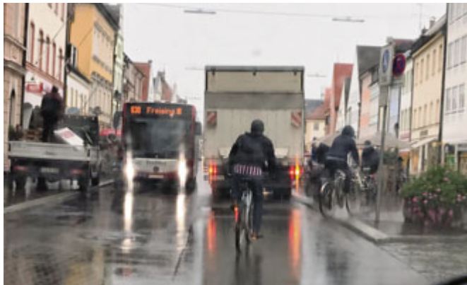
Schon bald in der Bezirksstraße? Beim Aufeinandertreffen von Bussen mit anderen Verkehrsteilnehmern könnte, wie in der Unteren Hauptstraße Freisings (siehe Bild), schon bald nichts mehr gehen (Foto aufgenommen am 13.10.2016)

Noch einmal: Wir halten die Bezirksstraße mit der Haltestelle Heimgartenstraße (in der Alleestraße) für ausreichend mit dem öffentlichen Personennahverkehr erschlossen und denken, dass die Busse eben nicht ganz locker mit dem fahrenden und stehenden Lieferverkehr, Kunden- und Durchgangsverkehr in der Bezirksstraße aneinander vorbeikommen. Das gelingt andernorts nicht einmal ohne den Durchgangsverkehr, siehe