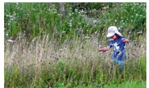
Im Ostteil des Moos-Haide-Parks zeigen die Unterschleißheimer Ausgleichsflächen, wohin die Entwicklung gehen könnte