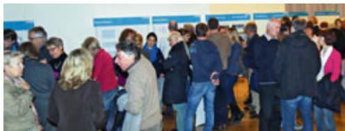
Konstruktiver Dialog zur künftigen Entwicklung von Unterschleißheim an den Themenständen

Die Präsentation des Abends ist ab sofort auf der Homepage der Stadt unter www.unterschleissheim.de einsehbar.