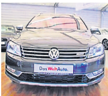
VW Passat Variant Alltrack 2,0 TDI DSG , Black Oak Brown Metallic, Diesel, 125 kW, 35.900 km, EZ 23.8.13, Lederausstattung, Ambientepaket, Spurwechselassistent, Rückfahrkamera, u.v.m. (Umsatzsteuer ausweisbar) € 32.990,-