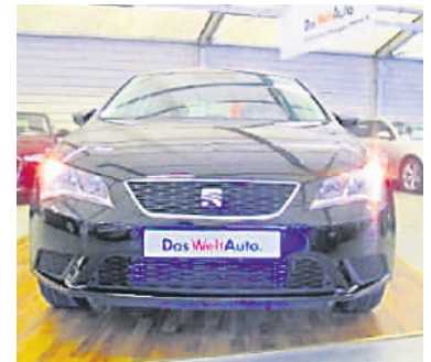
Seat Leon 1,2 TSI Reference - EU6 , Midnight Schwarz, Benzin, 81 kW, 50 km, EZ 13.11.15, Klimaanlage, Sitzheizung, Winterpaket, Tagfahrlicht, Leuchtweitenregulierung u.v.m. (Umsatzsteuer ausweisbar) € 16.990,-