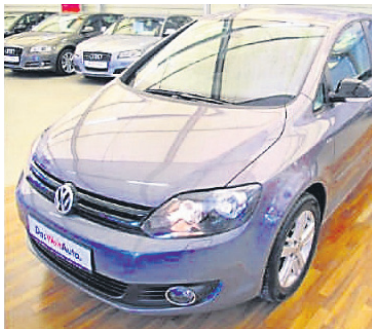
VW Golf Plus 1,4 TSI Match - PDC , United Grey Metallic, Benzin, 90 kW, 38.600 km, EZ 13.9.12, Climatronic 2-Zonen, Sitzheizung, Berganfahrassistent, Spiegel-Paket, Park-Distanz-Kontrolle u.v.m. € 15.490,-