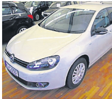
VW Golf VI 2,0 TDI DPF BMT Match , Silver Leaf Metallic, Diesel, 103 kW, 31.800 km, EZ 16.1.13, Klimaautomatik, Abbieglicht, Sitzheizung vorn, Berganfahrassistent, Park-Distanz-Kontrolle u.v.m. (Umsatzsteuer ausweisbar) € 15.490,-