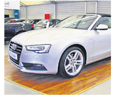
Audi A5 Cabriolet 1,8 TFSI Multitronic , Eissilber Metallic/Schwarz, Benzin, 125 kW, 71.600 km, EZ 26.7.12, Komfortklimaautomatik 3 Zonen, Licht-Paket, Xenon-Scheinwerfer Plus u.v.m. (Umsatzsteuer ausweisbar) € 29.990,-