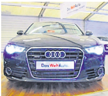
Audi A6 3,0 TFSI Quattro S Tronic , Phantomschwarz Perleffekt, Benzin, 228 kW, 51.700 km, EZ 22.6.12, Komfortklimaautomatik 4-Zonen, Lederausstattung, Adaptive Light, Standheizung u.v.m. (Umsatzsteuer ausweisbar) € 35.990,-