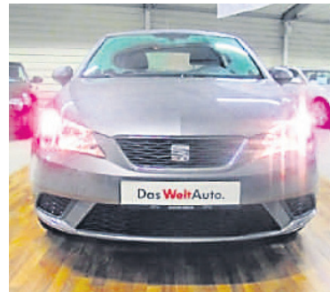
Seat Ibiza 1,2 TSI Reference - Klima , Technic Grau, Benzin, 66 kW, 50 km, EZ 26.11.15, Klimaanlage, Reifenkontrollanzeige, Bordcomputer, Tagfahrlicht, Multifunktionsanzeige/Bordcomputer u.v.m. (Umsatzsteuer ausweisbar) € 13.490,-