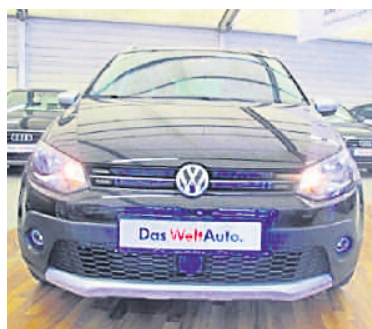
VW Polo Cross 1,2 TSI BMT - ACC , Deep Black Perleffekt, Benzin, 66 kW, 50 km, EZ 30.11.15, Climatronic, Berganfahrassistent, Müdigkeitserkennung, Leuchtweitenregulierung, Lichtsensor u.v.m. (Umsatzsteuer ausweisbar) € 16.990,-