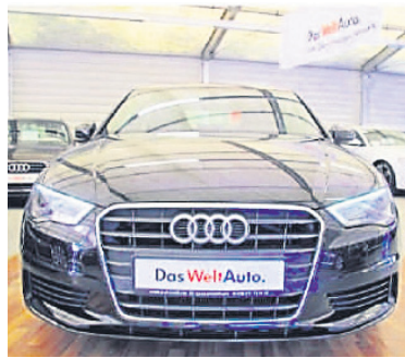
Audi A3 Limousine 1,4 TFSI S Tronic S , Phantomschwarz Perleffekt, Benzin, 103 kW, 32.900 km, EZ 24.9.13, Komfort-Klimaautomatik, Kurvenlicht, S line Sportpaket, Xenon-Scheinwerfer Plus u.v.m. (Umsatzsteuer ausweisbar) € 25.990,-