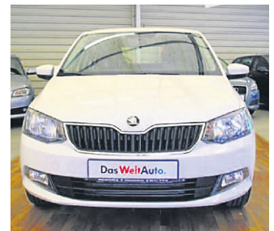
Skoda Fabia III Combi 1,2 TSI Ambition , Candy-Weiss, Benzin, 66 kW, 50 km, EZ 30.4.15, Klimaanlage, Chrom-Paket, Einparkhilfe hinten, Tagesfahrlicht, AUX-IN, USB (iPod-fähig), Getriebe 5-Gang u.v.m. (Umsatzsteuer ausweisbar) € 14.990,-