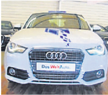
Audi A1 Sportback 1,6 TDI DPF , Gletscherweiss Metallic, Diesel, 66 kW, 53.200 km, EZ 21.9.12, Klimaautomatik, Sitzheizung, competition kit Aerodynamik, Xenon-Scheinwerfer Plus u.v.m. (Umsatzsteuer ausweisbar) € 16.990,-