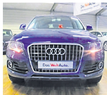
Audi Q5 2,0 TDI Quattro S tronic - AHK , Scubablau Metallic, Diesel, 130 kW, 105.700 km, EZ 17.12.12, Klimaautomatik, Designpaket, Einparkhilfe hinten, Licht-/Regensensor u.v.m. (Umsatzsteuer ausweisbar) € 26.990,-

Überdachter Ausstellungsplatz Montag bis Freitag 09.00 Uhr bis 18.00 Uhr Samstag 09.00 Uhr bis 13.00 Uhr Wir beraten Sie gerne: Georg Moralidis Tel: 089 / 317 758 - 11 Florian Langer Tel: 089 / 317 758 - 19