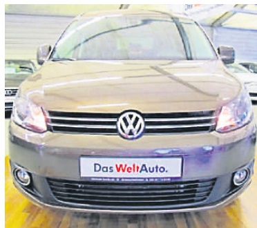
VW Caddy Maxi Life 1,2 TSI , Toffeebraun Metallic, Benzin, 77 kW, 110.000 km, EZ 24.7.12, Klimaanlage, Chrom-Paket, Park-Distance-Control, Multifunktionsanzeige/Bordcomputer u.v.m. (Umsatzsteuer ausweisbar) € 15.990,-