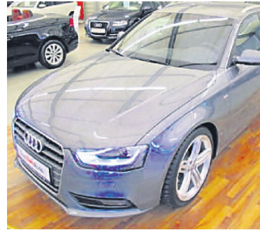
Audi A4 Avant 2,0 TDI S line , Monsungrau Metallic, Diesel, 130 kW, 31.500 km, EZ 4.6.13, Komfortklimaautomatik 3 Zonen, Sitzheizung vorn, Licht-Paket, Glanz-Paket, Bi-Xenon-Scheinwerfer u.v.m. (Umsatzsteuer ausweisbar) € 31.990,-