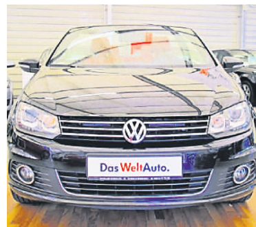
VW Eos 2,0 TSI DSG - Leder Xenon , Deep Black Perleffekt, Benzin, 155 kW, 77.000 km, EZ 10.10.11, Climatronic 2-Zonen, Abbieglicht, Lederausstattung, Sitzheizung vorn, Kurvenlicht u.v.m. (Umsatzsteuer ausweisbar) € 19.990,-