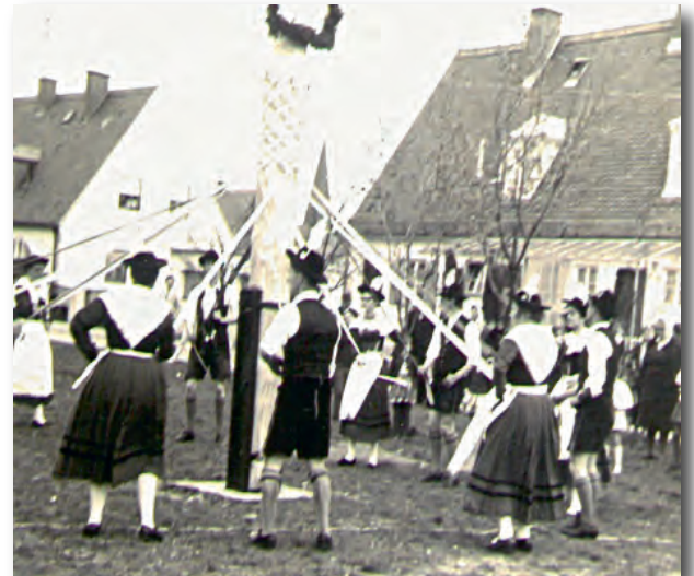
Bandtanz am frisch aufgestellten Maibaum 1965 – erstmals Birkenstraße Ecke Johann-Schmid-Straße