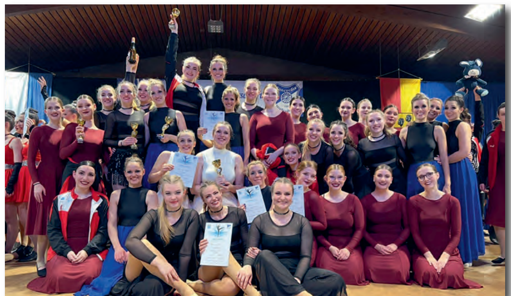
Erfolgreiches Turnier für die Mädels des TSV Schleißheim

Fans. Auch die Jury war ganz angetan und schickte die Mädels mit dem Titel des Bayerischen Vize-Meisters nach Hause. Nach Hause bedeutete für die Tänzerinnen,