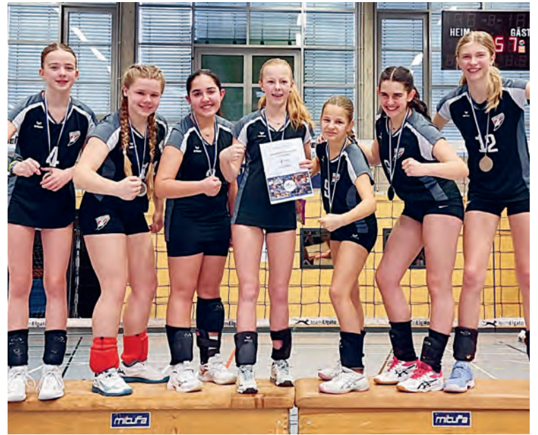
Großer Jubel über die Silbermedaille und die Qualifikation zur Deutschen Meisterschaft