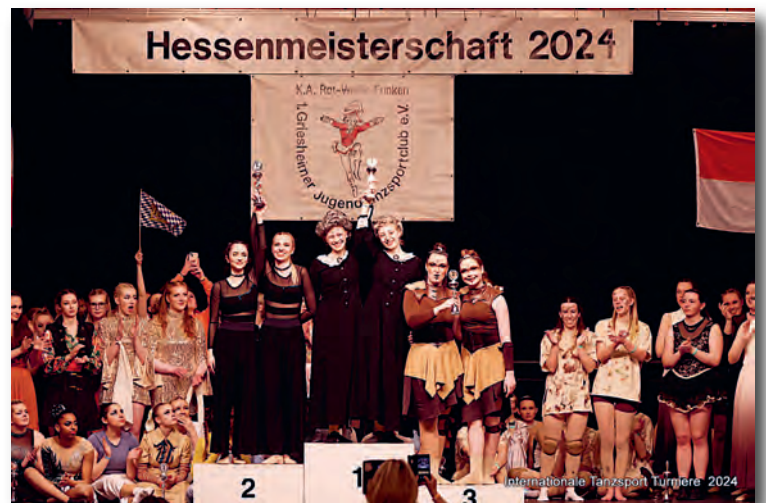
Jazz No. 1 auf dem 2. Platz im Showtanz