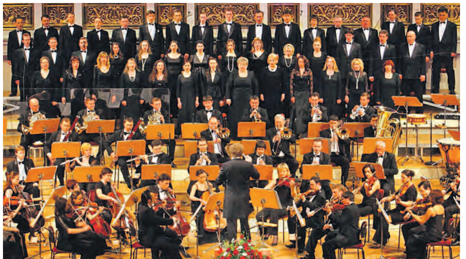
KENDLINGER'S K&K PHILHARMONIKER PRÄSENTIEREN

Eine spannende Performance verheißt auch der Part des international renommierten