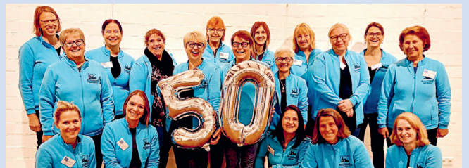
Nachbarschaftshilfe Garching – 50 Jahre Basar für Kinderartikel