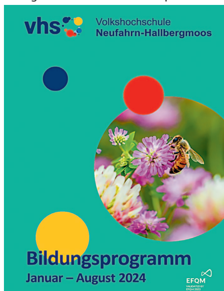
Titelbild neues Heft