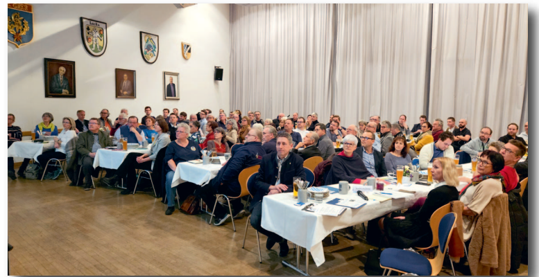
Bis auf den letzten Platz besetzter Saal

Das Team vom Restaurant La Solana verwöhnte die Gäste mit einer bayerischen Brotzeit und gewohnt freundlichem Service.