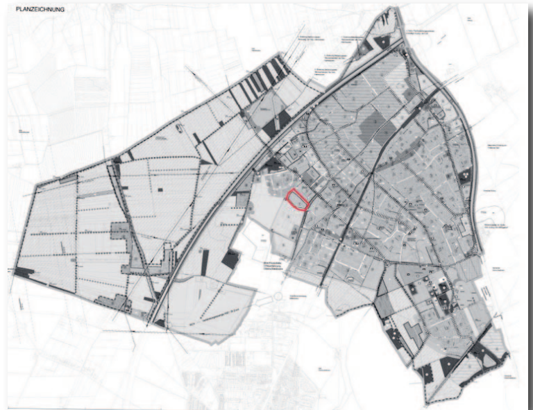
○ Lage Planungsbereich im Stadtgebiet