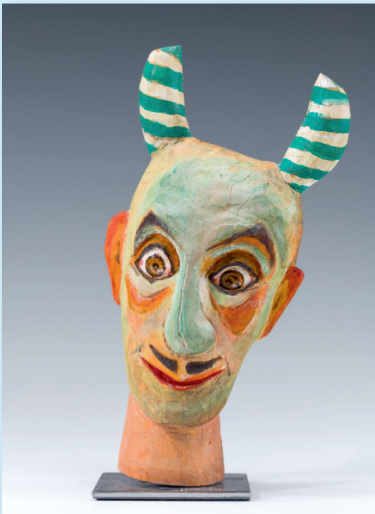
Höllisch gut! Teufelsfiguren von Dana Westpfahl